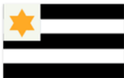
Obr. 135 Sportovní klub České Budějovice