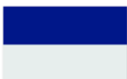
Obr. 72 Sportovní klub Píero