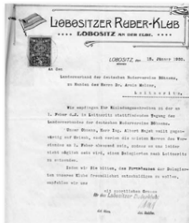
Hvězdicový papír s kresbou vlajky užitý ve 20. letech 20. století.