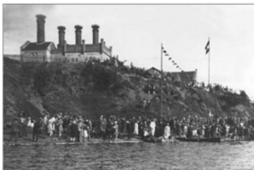
Majkolistina při veslařských závodech v Těbově v roce 1925 (Šechtl a Vasoček).