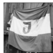
Nahoře vlevo: Vítězové 9. závodu o středobálský pohár v roce 1930.