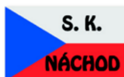
Obr. 80 Sportovní klub v Náchodě