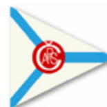
Obr. 139 Československý amatérský plavecký svaz