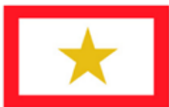
Obr. 134 Veslařský závodní spolek pražský