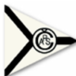
Obr. 138 Český svaz plavecký (černobílá varianta)