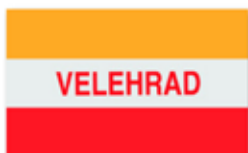
Obr. 66 Veslařský spolek Velehrad v úherském Ostrohu/Ruderverein Velehrad in Ungarisch Ostra