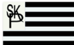
Obr. 76 Sportovní klub Píero