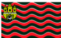
Obr. 132 Klub vodních sportů Praha