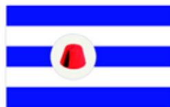
Obr. 142 TJ FEZKO Stakonice