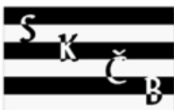
Obr. 136 Sportovní klub České Budějovice (černobílá varianta)