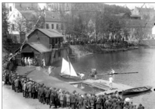
Loděnice klubu v roce 1927 (Šechtl a Vasoček).