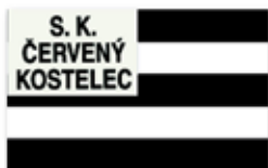
Obr. 131 Sportovní klub v Červeném Kostelci